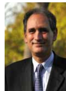
Jean-Loup Salzmann Président de l'Université Paris 13

Paris 13, ce sont aussi 4 campus verdoyants et modernes. Avec 120 nouveaux logements livrés pour les années 2009-2011 et 200 autres à livrer en août 2011, le logement étudiant est au centre des priorités. Une accessibilité au réseau wifi sur tous les campus, des applications de géolocalisation et des informations en temps réel (Unimobil sur son mobile), une salle d'informatique (Learning Center) ouverte 24h/24, des bibliothèques modernisées aux horaires d'ouverture élargis jusqu'à 22h, des cours à podcaster : l'Université Paris 13 innove constamment pour permettre à ses étudiants de travailler dans les meilleures conditions.