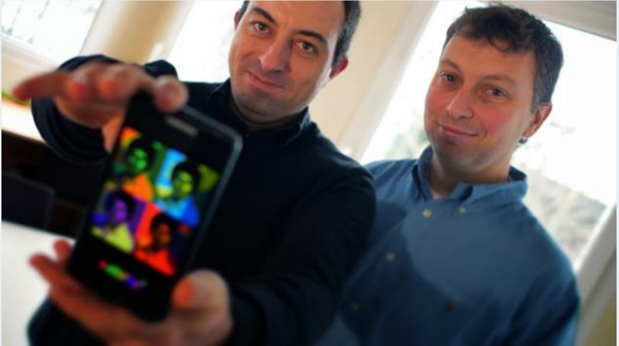
• Les entrepreneurs du projet incubé FeetDaPop