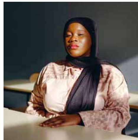
Les étudiants © Clara Iparraguirre