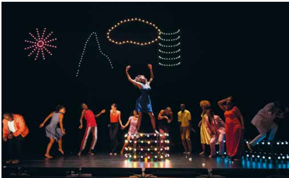
D'un rêve