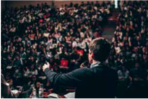
Eloquence : la finale