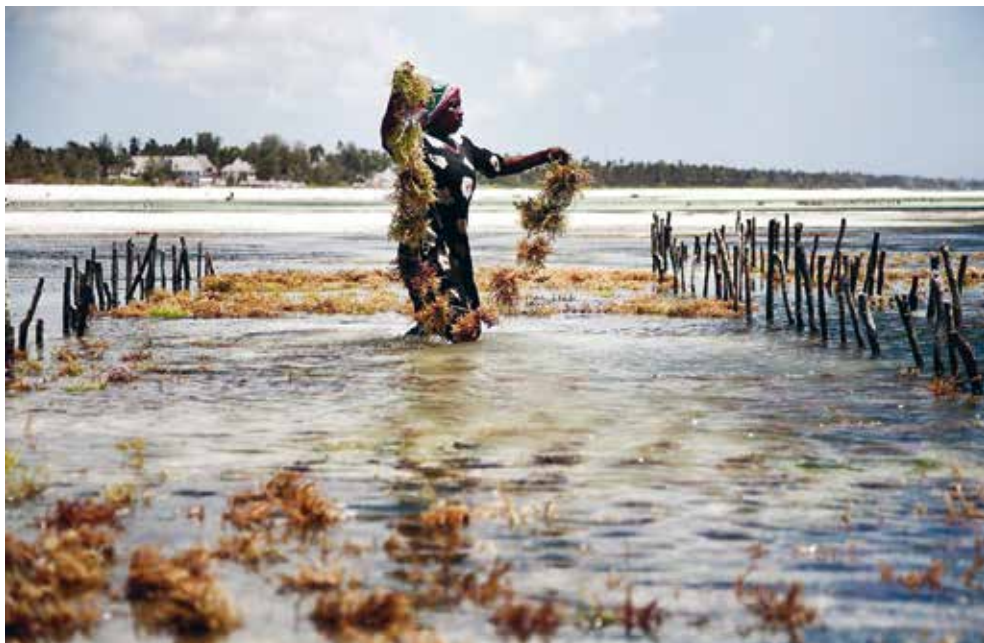
Expo African Workplaces