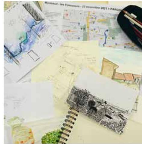
Parcourir le paysage

Mercredi 6 avril 2021 à 10h30, La Chaufferie