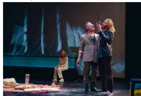
Dans la fumée des joints de ma mère

Vendredi 18 février à 20h, Espace Cardin Dans le cadre de la saison du Théâtre de la Ville hors les murs