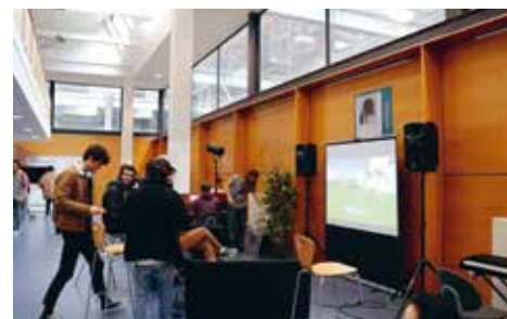
Battle jeux vidéo

Mardi 8 mars de 10h à 18h, Hall de l'illustration.