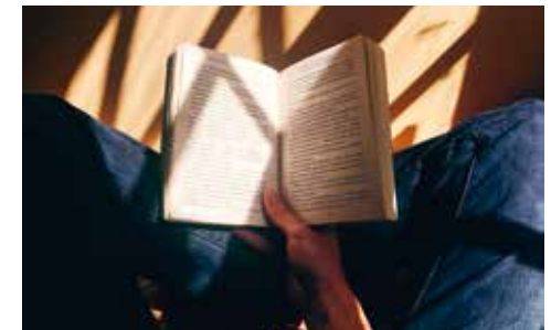
Prix littéraire

À vous d'élire et de mettre en lumière le livre que vous aurez préféré parmi les romans suivants :