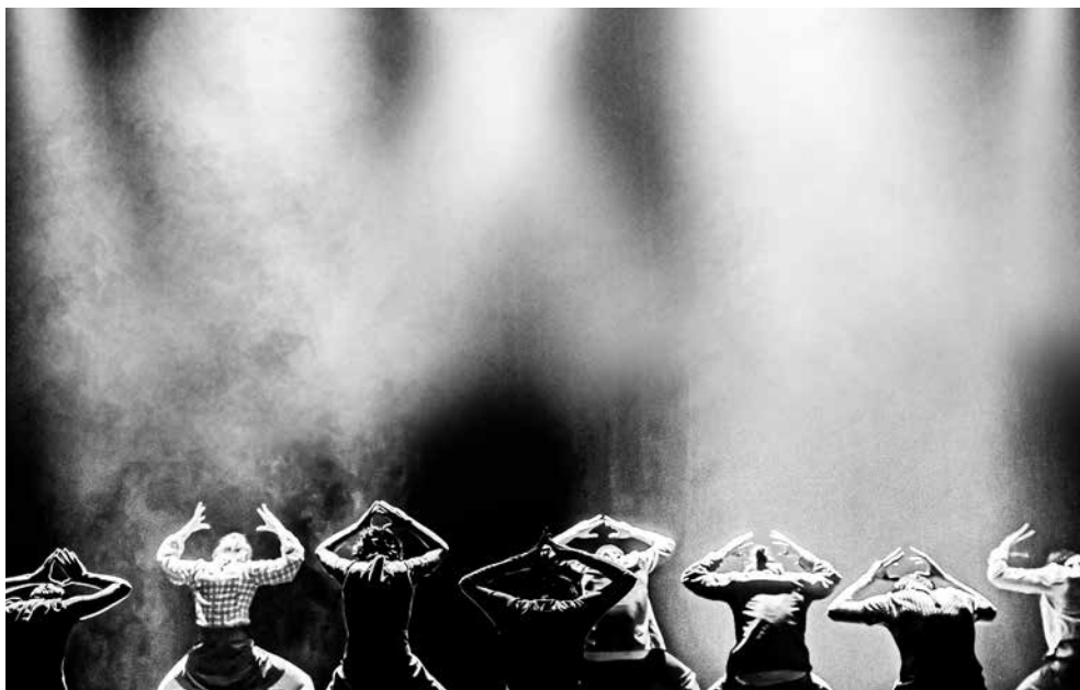
Contemporary Dance 2.0