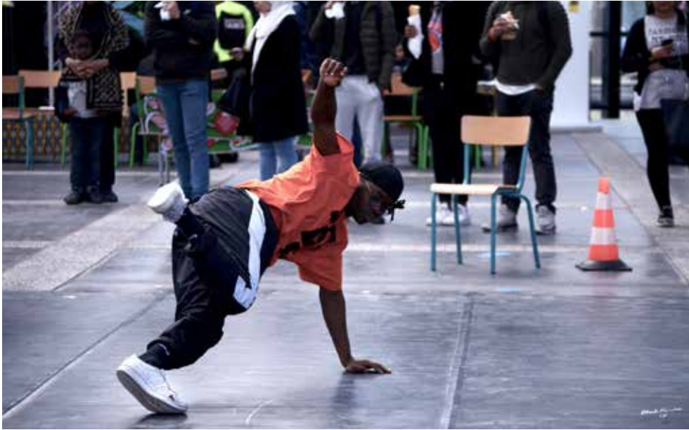
Battle Hip-hop