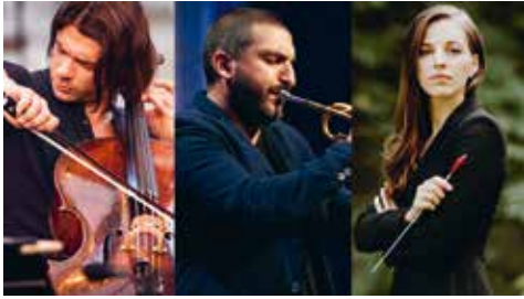
Free Spirit © Gregory Batardon Christophe Filleule - Festival de Saint-Denis Zuzanna Specialsite