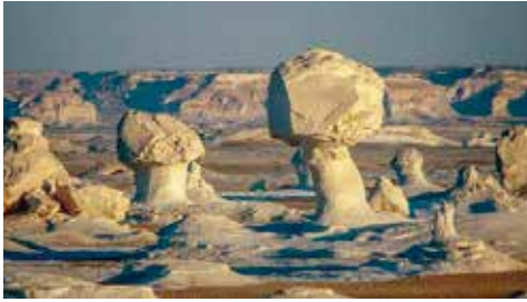
Long Play