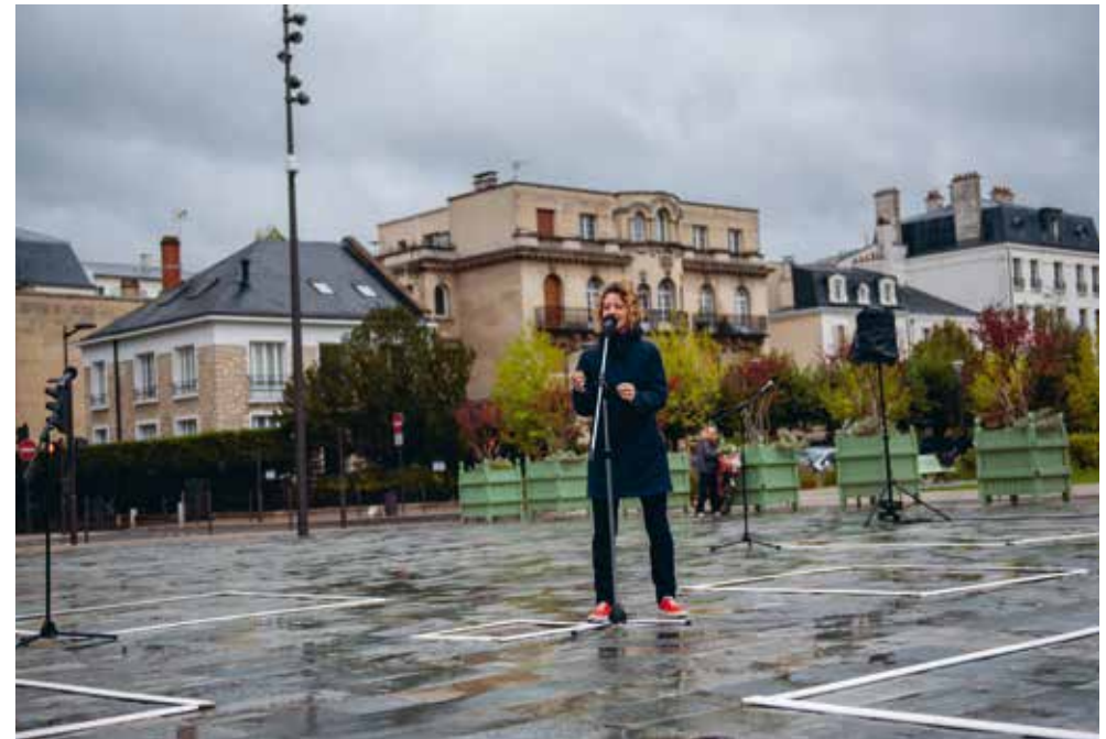
Parrésia#2 © AC-Compan

Vendredi 25 mars à 13h, Foyer de l'Illustration, Campus de Bobigny