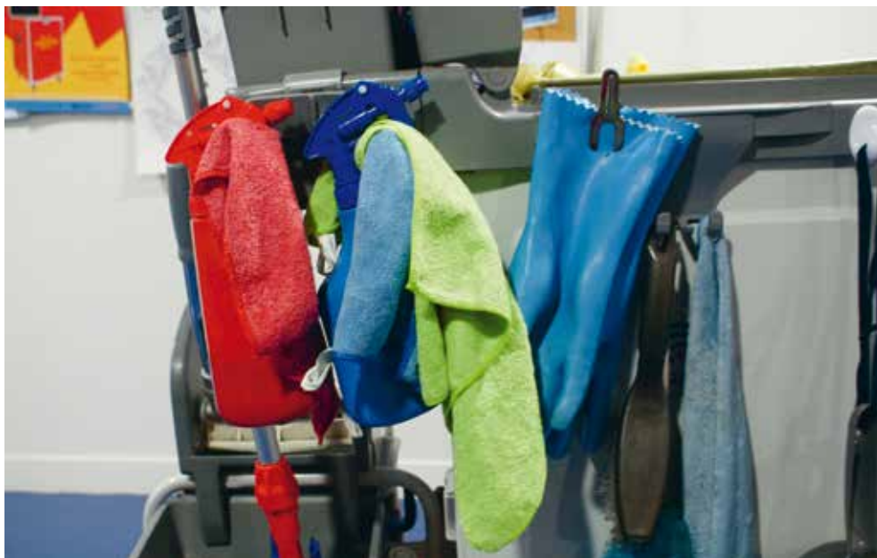
Travail #Visible

prend peu à peu la forme d'une société algorithmique. Sa mutation nécessite une exploitation massive de nos données personnelles qu'il s'agit de recueillir, organiser, monétiser. Les œuvres présentées ici illustrent, de manière ludique, esthétique et déroutante ce « nouvel extractivisme » qui s'opère dans l'ombre des internautes et de la loi.