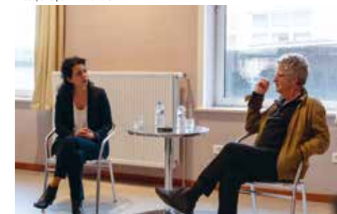
Passeports pour la liberté

Jedi 17 mars à 11h, Amphithéâtre Robert Escarpit